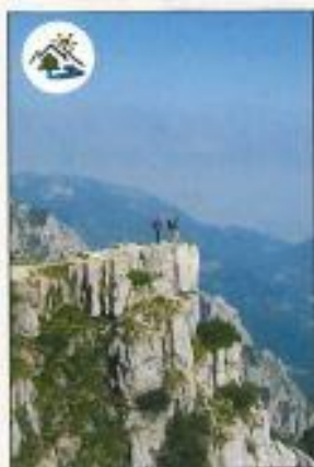
Monti del Pasubio